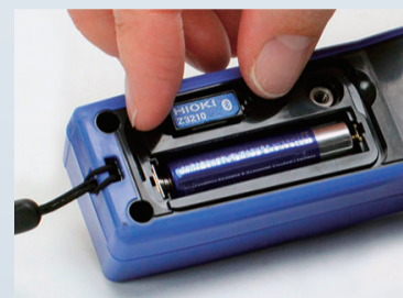
Bước 1: Lắp Z3210 vào thiết bị của bạn